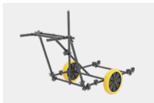
Fahrbares Trägersystem VMXV1