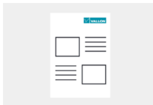
Montage- und Bedienungsanleitung VMXV1 Art.-Nr. 8903220950