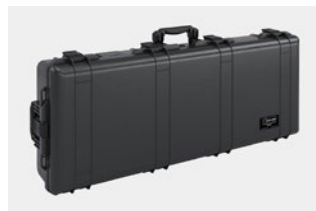
Koffer VMXV1 Art.-Nr. 2903220560