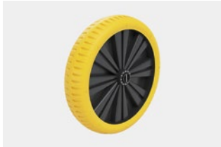
Ersatzrad VMXV1 Art.-Nr. 2903220500