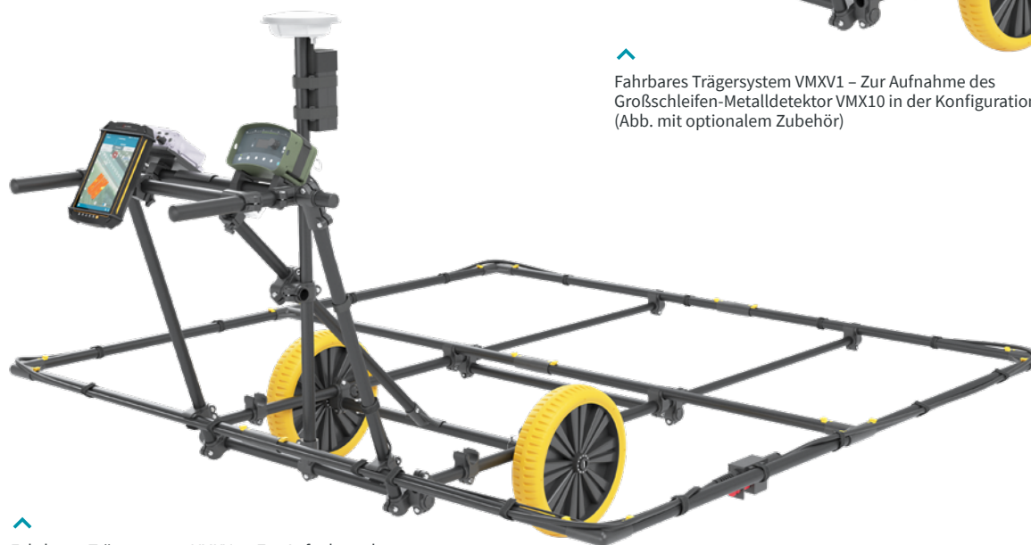
^ Fahrbares Trägersystem VMXV1 – Zur Aufnahme des Großschleifen-Metalldetektor VMX10 in der Konfiguration 2 x 2 m (Abb. mit optionalem Zubehör)