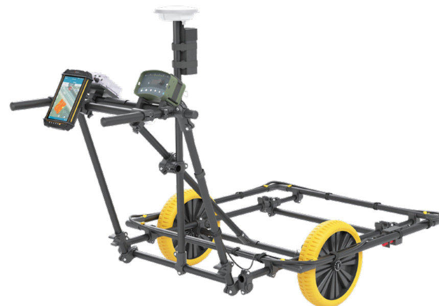
^ Fahrbares Trägersystem VMXV1 – Zur Aufnahme des Großschleifen-Metalldetektor VMX10 in der Konfiguration 1 x 1 m (Abb. mit optionalem Zubehör)

Änderungen, die dem technischen Fortschritt dienen, vorbehalten.